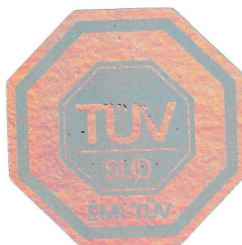
Varjú András Head of Department ÉMI-TÜV SÜD Kft. KERMI Department

Remark: The result relates only to the items tested. No extract, abridgment or abstraction from a test report / attestation may be published or used to advertise a product without the written consent of the Head of ÉMI-TÜV SÜD Ltd., KERMI Department. The results contained in the test report apply only to the particular samples tested and to the specific test carried out.